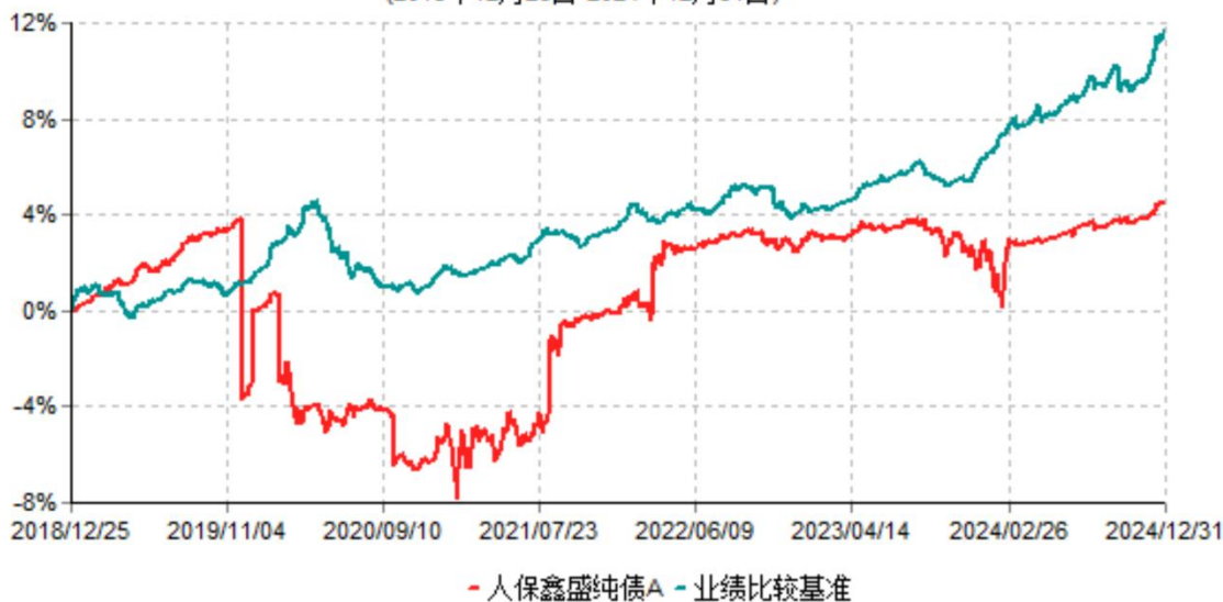
人保鑫盛纯债A累计净值增长率与业绩比较基准收益率历史走势对比图 (2018年12月25日-2024年12月31日)