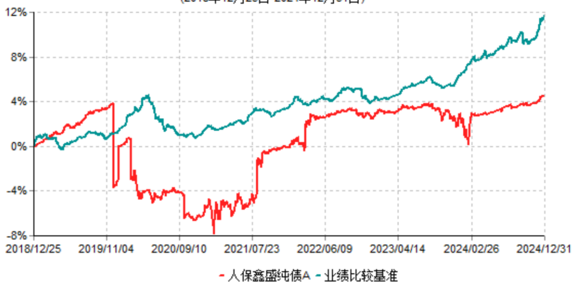
人保鑫盛纯债A累计净值增长率与业绩比较基准收益率历史走势对比图 (2018年12月25日-2024年12月31日)